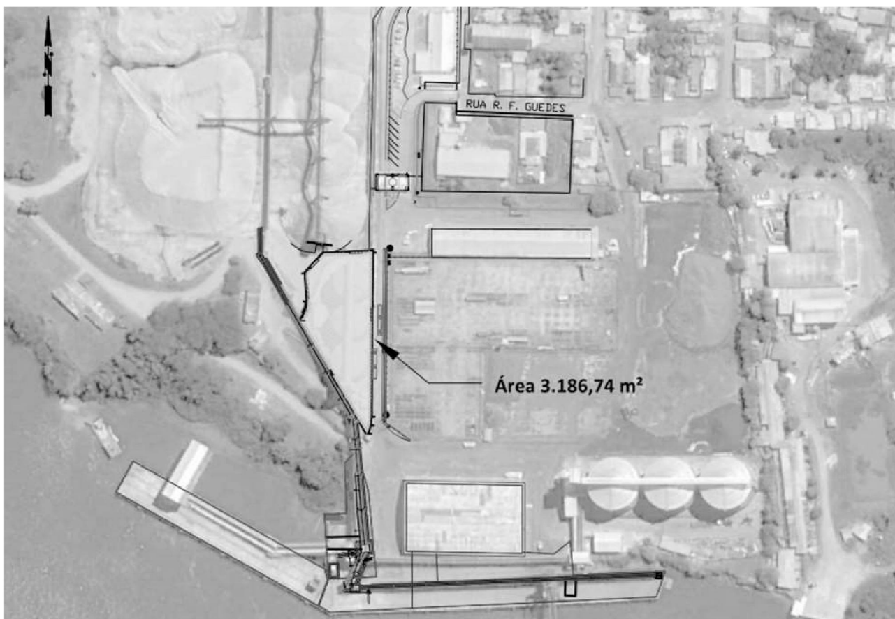
Figura 5 – Área de arrendamento MCP02 – Porto de Santana.

A área objeto do presente EVTEA é atualmente um brownfield com estruturas existentes e está localizada dentro do Porto Organizado de Santana, possuindo uma superfície total de 3.186,74 m 2 , conforme ilustrado nas figuras a seguir.