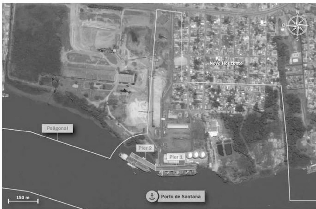
Figura 4 – Infraestrutura de acostagem

A Figura 4 mostra a infraestrutura de píer do Porto de Santana.