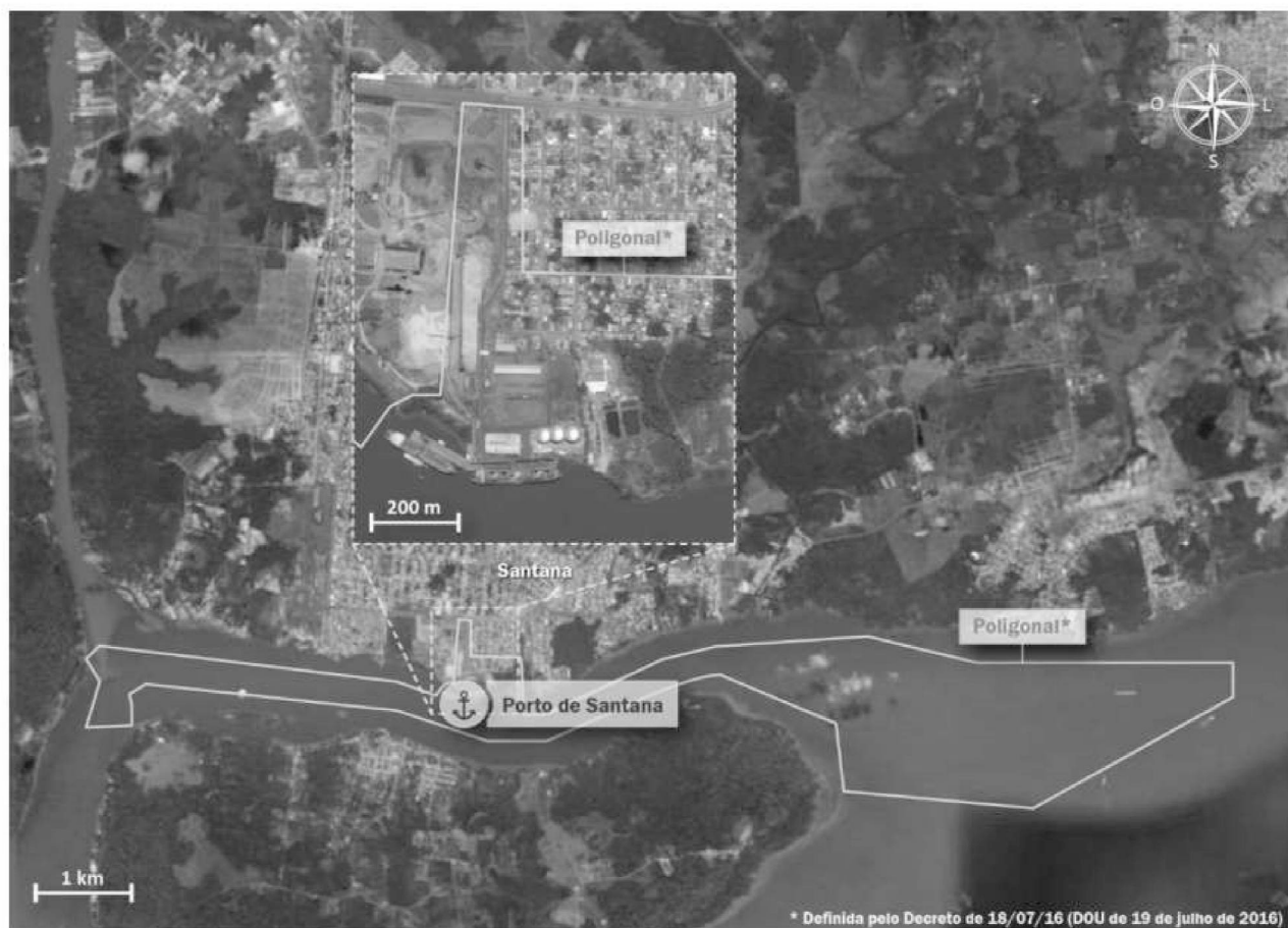
Figura 2: Localização do Porto de Santana