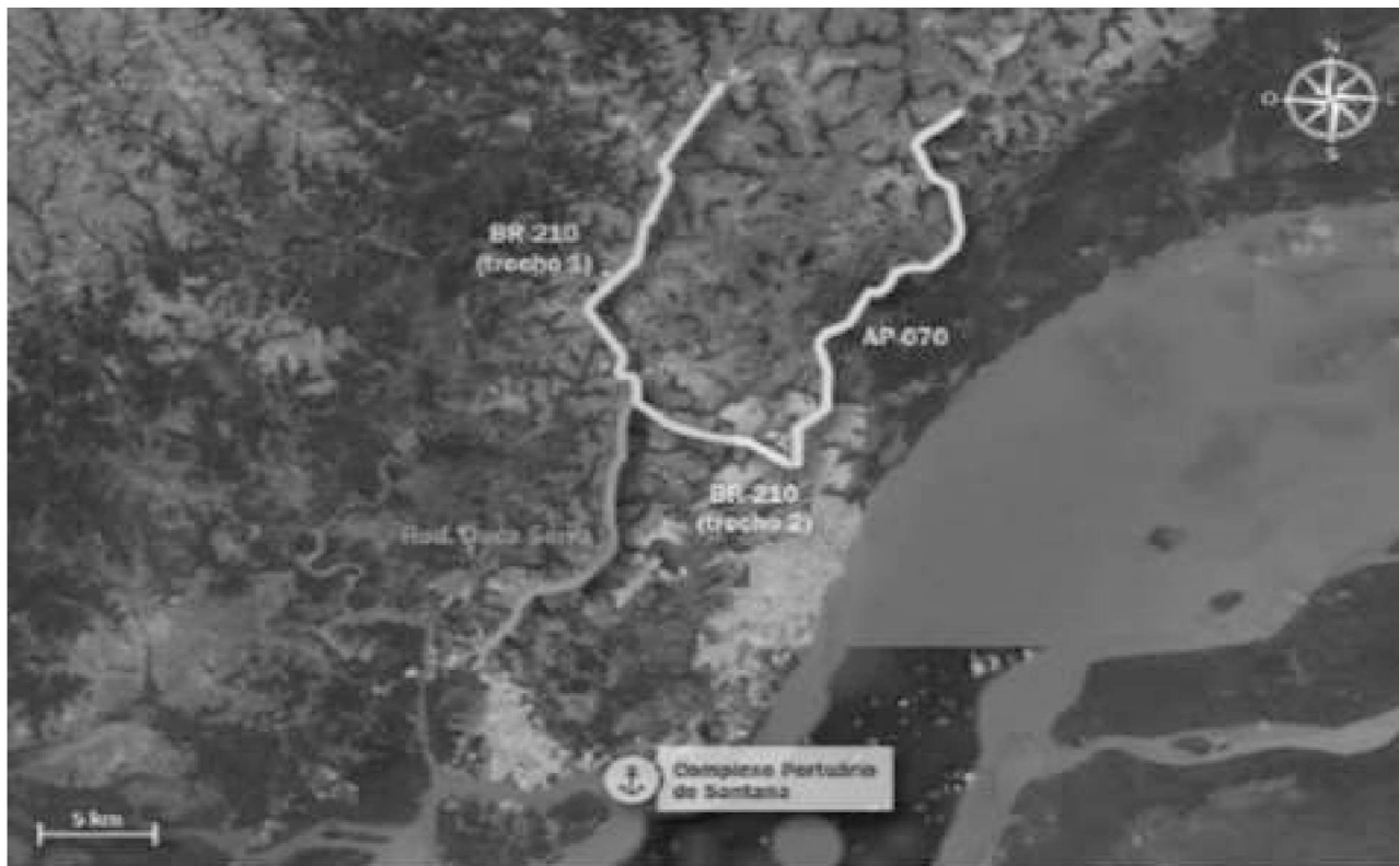
Figura 3 – Visão geral da malha rodoviária – acesso ao Porto de Santana

A rodovia Duca Serra possui um segmento menos urbanizado, que se encontra desde o entroncamento com a AP-010 até o entroncamento com a BR-210 e o outro segmento vai desse mesmo entroncamento até a Avenida Santana.